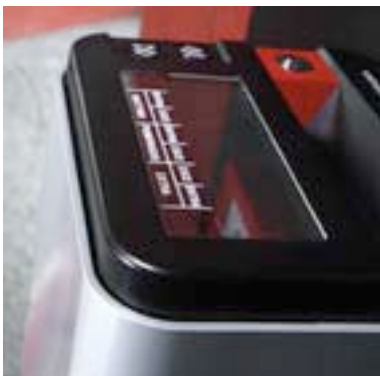
Particolare della testa del 3815